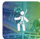
Corso DPI Anticaduta