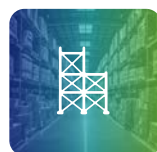
Corso Scaffalature Industriali