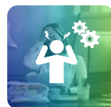
Corso Stress Lavoro Correlato