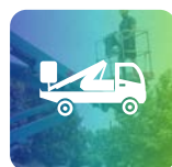
Corso Piattaforme di Lavoro Elevabili