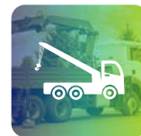
Corso Gru su Autocarro