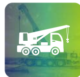
Corso Gru Mobile