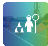
Corso Addetto Segnaletica Stradale