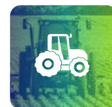
Corso Trattori Agricoli