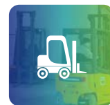
Corso Carrelli Elevatori Industriali