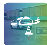
Corso Sicurezza alla Guida