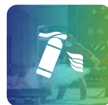
Corso Addetto Antincendio