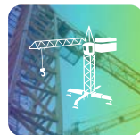
Corso Gru a Torre