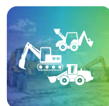
Corso Macchine Movimento Terra