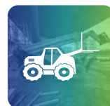
Corso Sollevatori Telescopici